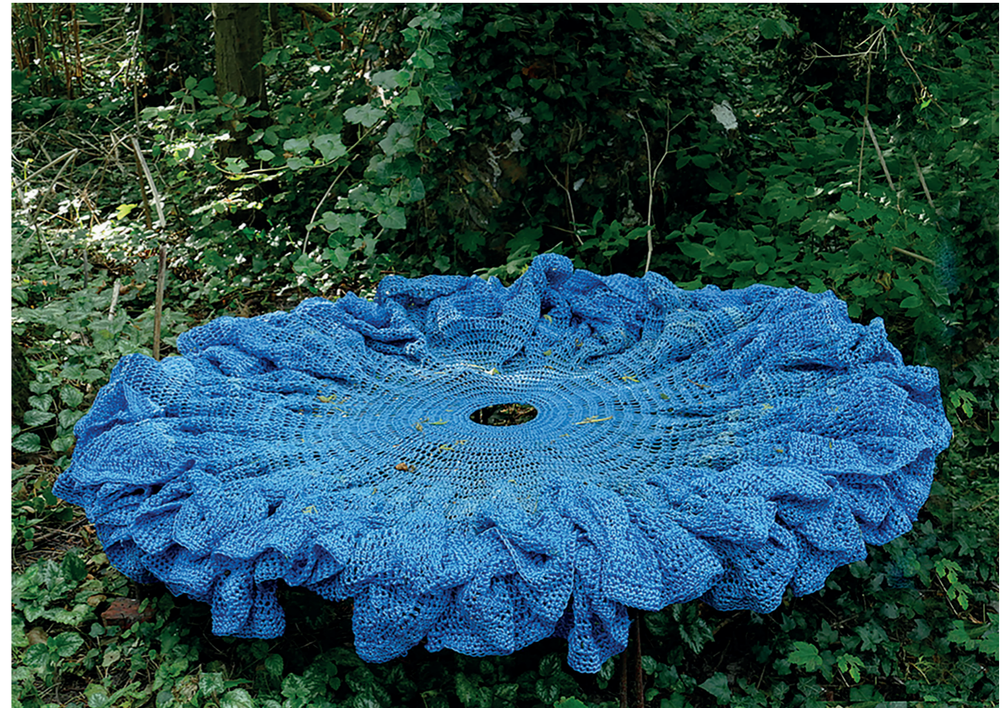
2008, 200 x 200 x 40 cm, object van visserstouw op ijzeren onderstel