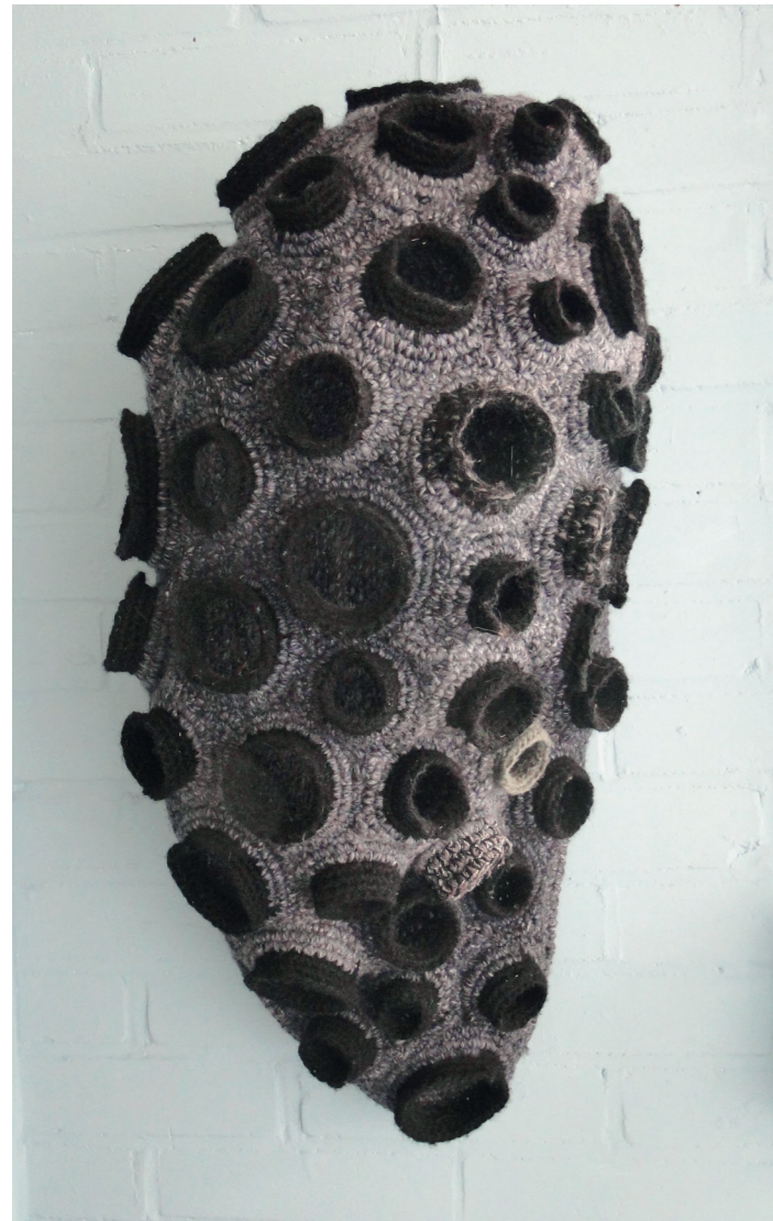
2020, 67 x 32 x 30 cm, wandobject van wol, ijzerdraad

In het Groningse Kloosterburen woont en werkt anne wine - geschreven zonder hoofdletters. Ze laat zich inspireren door de leegheid en ruimte van het land en de Waddenzee. Vanuit een sterke betrokkenheid bij de wereld maakt zij eenvoudige, organische bouwwerken van afvalmateriaal.