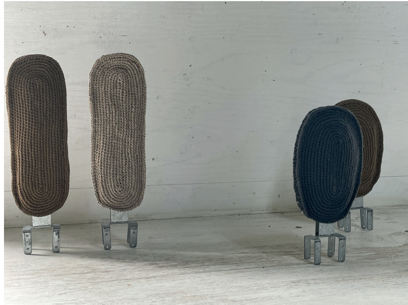
2023, 24 x 15 x 3 cm, katoen, wol, metaal

'Mijn thema is mededogen, essentieel in onze transformerende wereld'